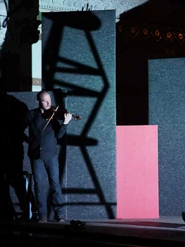
9 avril 2022, Basilique de Fourvière, Lyon