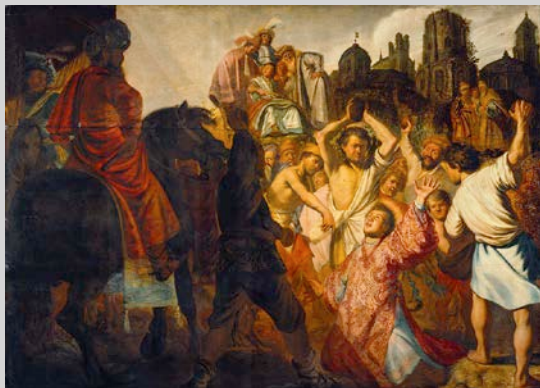
La Lapidation de Saint Étienne, Rembrandt, 1625, Musée des Beaux-Arts de Lyon

Telli Sabata, association culturelle, Charnay (69)